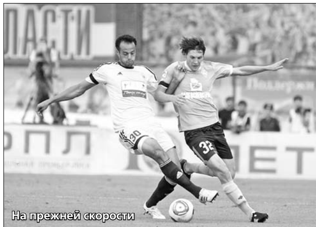
На прежней скорости