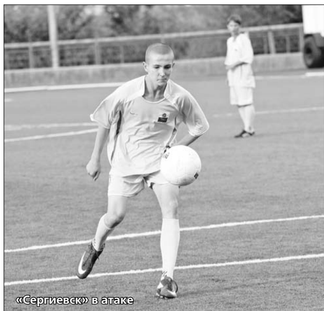
«Сергиевск» в атаке

С 20 по 23 октября на суходольских стадионах «Олимп» и «Центральный» проходил 12-й открытый областной турнир по футболу среди юношей 96 - 97 годов рождения на кубок легендарного вратаря Льва Ивановича Яшина.