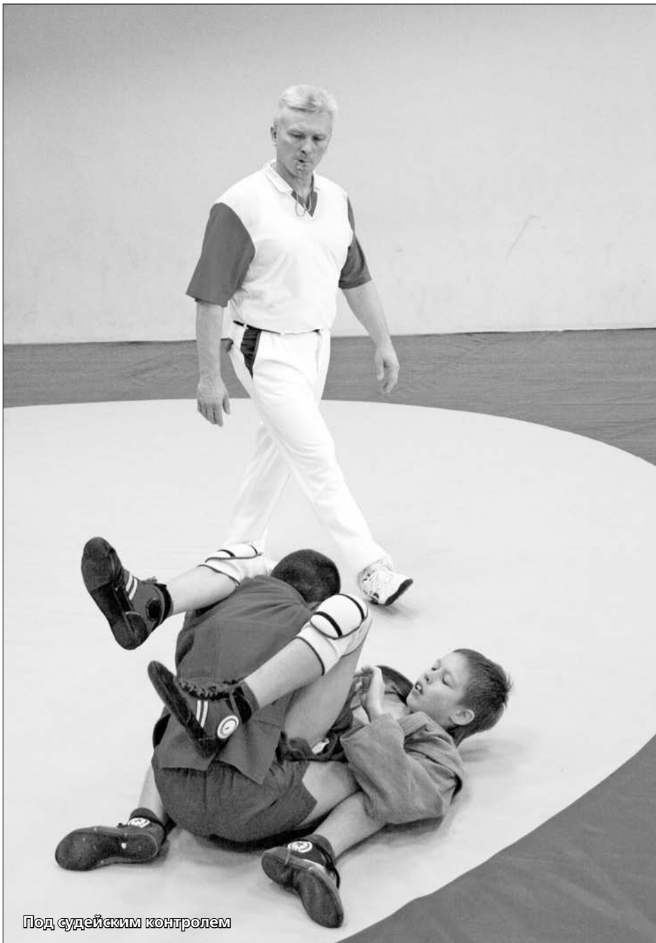
Под судейским контролем

В очередной раз в Автограде состоялось первенство городского округа по самбо среди юношей 1998-99 г.р.