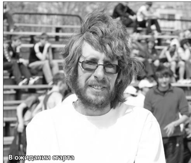
В ожидании старта

Второе место в минувшем сезоне заняла команда «Спортивные клубы», выигравшая два первых вида - перетягивание каната и баскетбольный турнир. Уверенно стартовав, ветераны спорта не смогли по ходу марафонской дистанции «перезарядить батарейки» и финишировали довольно вяло. Бронзовым призером 2-й спартакиады стала команда «МРСК Волги», одержавшая победу в турнире по шахматам. Она, кстати, является победителем 1-й